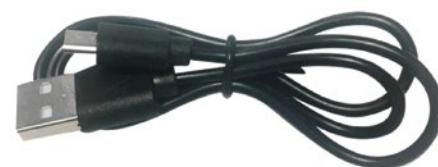
Incluye cable de carga